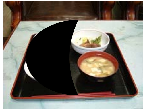
同名半盲の方の視野（左マヒの方）