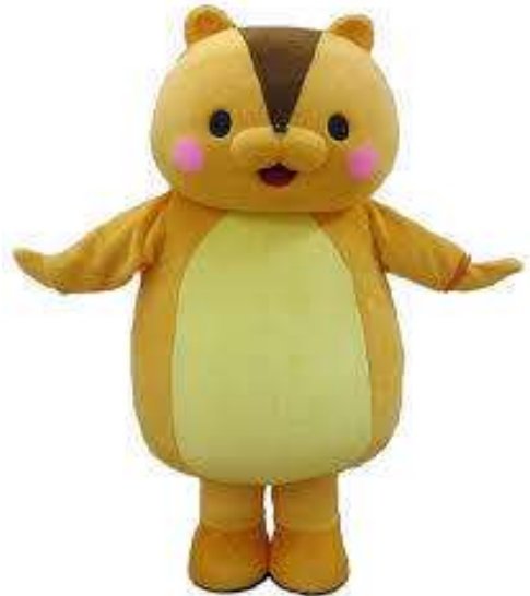
品川区認知症対策の普及啓発キャラクター くるみちゃん